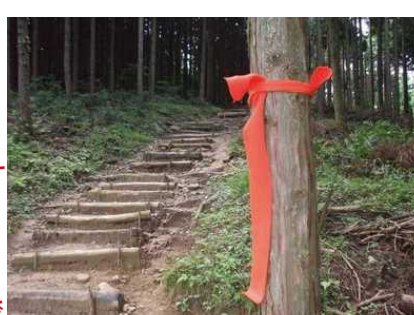
オレンジ色の誘導マーカ 約30~50m間隔

■コースの走破 誘導マーカに従って走行してください。 ・ごみを捨てない。 ・追い抜きは一声かけて右側から。 遅いランナーは左側へよける。