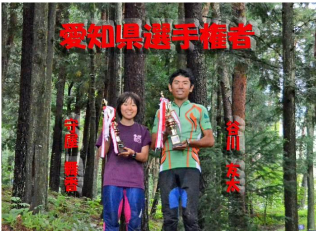
昨年度のチャンピオン